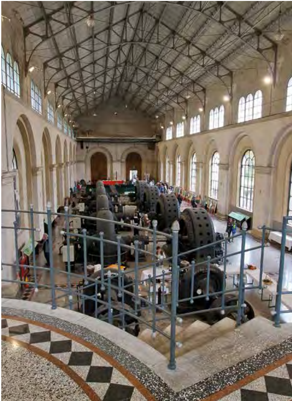
La sala macchine della Centrale-Museo Antonio Pitter di Malnisio nel Comune di Montereale Valcellina, sede della mostra "ARTI&MESTIERI - La pittura incontra il mondo dell'artigianato"