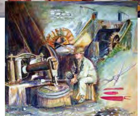
Tiberio Giurissevich Stagnino / Fabbro al maglio